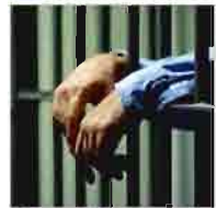
Carceri, la mappa del sovraffollamento