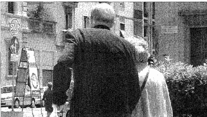
Si rivalutano i redditi pensionistici

A tal proposito - ha concluso Marinelli - abbiamo a piu' riprese sottolineato l'importanza di giungere ad un compimento quanto mai celere dell'iter parlamentare della legge dell'onorevole Giuliano Cazola".