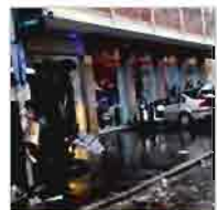
Incidente stradale: un morto e 5 feriti a Milano